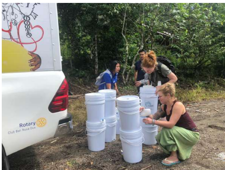
Ook de familie Bol bracht ons een bezoek en kwam niet met lege handen